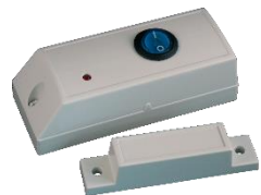
1189 – Daza Deurcontact