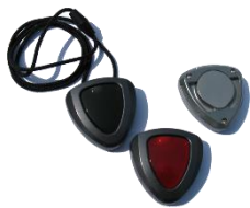
1184 – V2M - Daza Hals / Pols zender