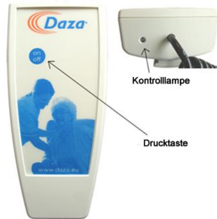
Abbildung 2: Drucktaste + Kontrolllampe