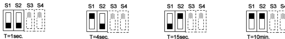
Figuur 3: Alarm vertraging

De Optiseat heeft een alarm vertraging. Dit is de tijd die de persoon heeft, om terug te gaan zitten voor het alarm gaat. Men kan hier kiezen uit 4 verschillende tijden. Keuzes uit deze standaard tijden zijn: 1, 4, 15 seconden en 10 minuten. De laatste (10 minuten) kan eventueel op aanvraag gewijzigd worden. De keuze uit deze 4 tijden geschiedt middels de eerste 2 schakelaars S1 en S2 (figuur 3).