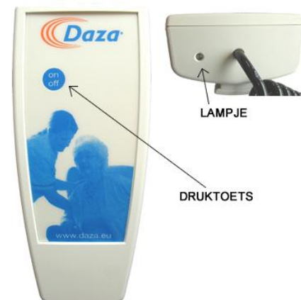
Figuur 2: druktoets + lampje