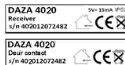
Figuur 5: Serienummer sets

De serienummers van beide componenten van de set zijn gelijk. Dit geeft aan dat het deurcontact en de ontvanger bij elkaar horen. U kunt deze dan ook niet onderling met een andere set uitwisselen. (figuur 5).