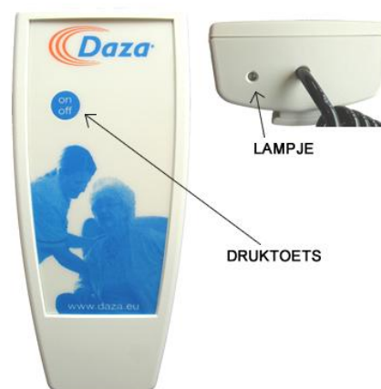
Figuur 2: druktoets + lampje