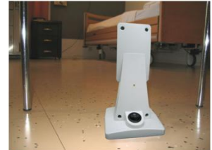
Figuur 1: Sensor Plaatsing

Plaats de sensor, kijkend richting het bed, op de vloer (figuur 1). Zorg ervoor dat de sensor op een veilige plek staat, zodat de bewoner hier geen last van heeft, bijvoorbeeld onder een stoel of kast. Het geniet sterk de voorkeur de sensor minimaal 2 meter van het bed te plaatsen. De sensor kijkt in een hoek van 90 graden over een afstand van circa 5 meter. Zorg ervoor dat er geen objecten direct voor de sensor staan (figuur 2).