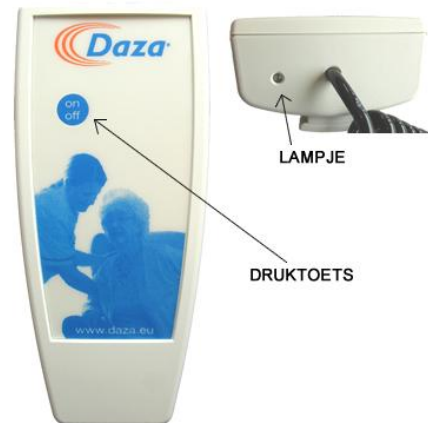
Figuur 1: druktoets + lampje