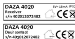
Figuur 5: Serienummer sets

De serienummers van beide componenten van de set zijn gelijk. Dit geeft aan dat het deurcontact en de ontvanger bij elkaar horen. U kunt deze dan ook niet onderling met een andere set uitwisselen. (figuur 5).