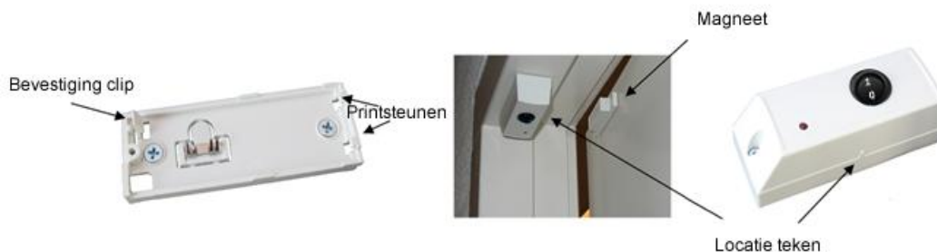
Figuur 2: Bodemdeel