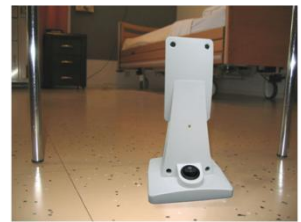
Figuur 1: Sensor Plaatsing

Plaats de sensor, kijkend richting het bed, op de vloer (figuur 1). Zorg ervoor dat de sensor op een veilige plek staat, zodat de bewoner hier geen last van heeft, bijvoorbeeld onder een stoel of kast. Het geniet sterk de voorkeur de sensor minimaal 2 meter van het bed te plaatsen. De sensor kijkt in een hoek van 90 graden over een afstand van circa 5 meter. Zorg ervoor dat er geen objecten direct voor de sensor staan (figuur 2).