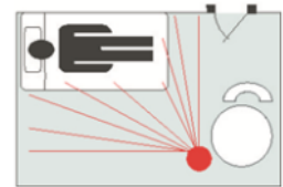
Figuur 2: Kijkhoek Sensor

Note: De sensor zal de eerste 5 sec. na inschakeling met de schakelaar nog geen alarmen doorzenden. Dit om een vals alarm bij inschakelen te voorkomen.